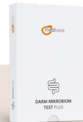
Mikrobiom-Analyse (PCR / DNA-Sequenzierung) inkl. Zonulin