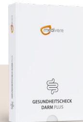
Mikrobiologische Analyse (Anzucht) inkl. Zonulin